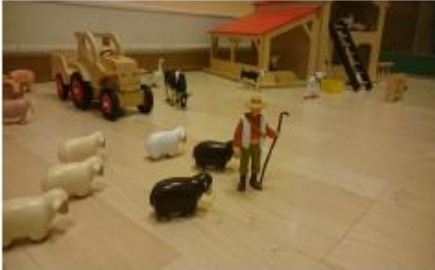
Les animaux de la ferme